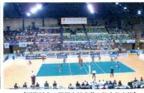
【国際試合の開催実績多数!総合体育館】