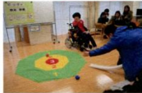
【きぼーとピア等で「ポッチャ」の体験が可能】