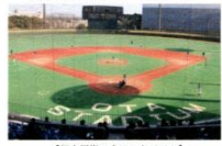
【都内屈指の大田スタジアム】